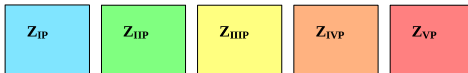
Rysunek nr 2. Sposób zaznaczania stopnia zagrożenia powiatu na mapie województwa