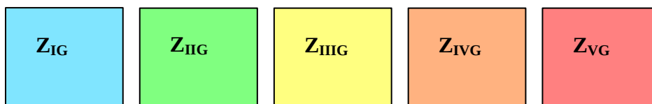
Rysunek nr 1. Sposób zaznaczania stopnia zagrożenia gminy na mapie powiatu